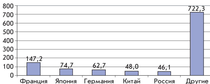
Рис. 1. Объем экспорта капитала различными странами мира в 2009 г., млрд дол. (источник: [7])

Наибольшую долю в общем объеме инвестиций составляют прочие инвестиции, которые включают в себя кредиты и займы иностранным государствам.